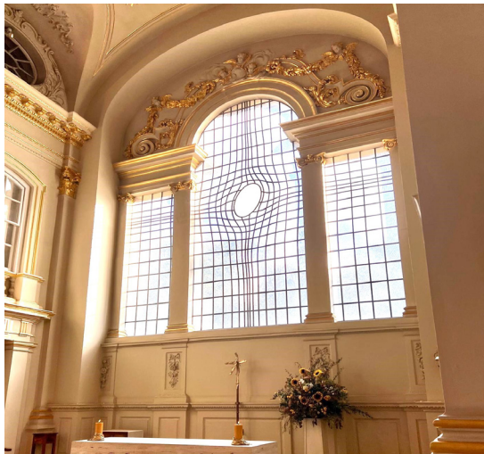
Ostfenster in St Martin-in-the-Fields, London

Nahe bei der gigantischen Nelsonsäule samt Springbrunnen, mitten im Gewusel aus Touristen und Verkehr gibt es am Trafalgar Square in London auch eine Kirche: St Martin-in-the-Fields, weltberühmt für ihre Musik, überlebenswichtig für viele Obdachlose in der Millionenmetropole und seit 2008 mit einem neuen Ostfenster, das mich bei meinem allerersten Augen-blick begeistert hat.