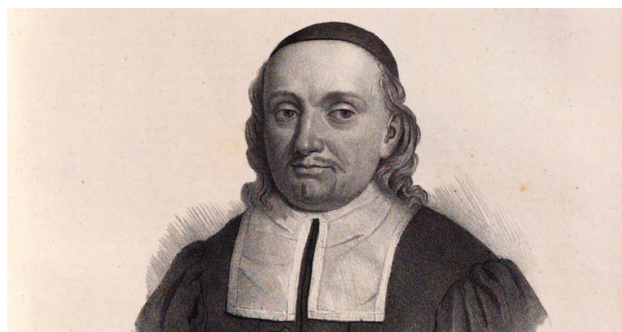
Foto: Paul Gerhardt (1607 - 1676)